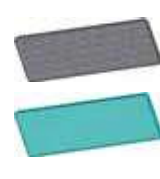
Фотокаталитический и антибактериальный фильтры